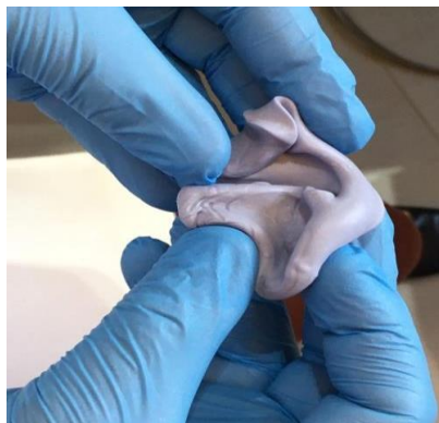
Figura 5 – Manipulação do silicone de adição para confecção do JIG.