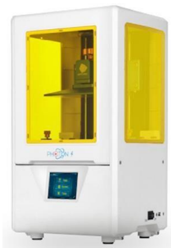
Figura 13 – Impressora 3D Anycubic Photons 4 ( Talmax ).