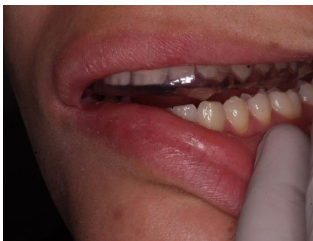
Figura 15 - Verifica o da guia canina.