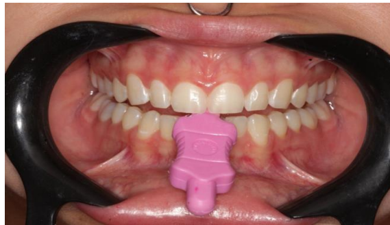
Figura 4 – Analise da distância oclusal com o dispositivo de registro na região anterior (3mm).