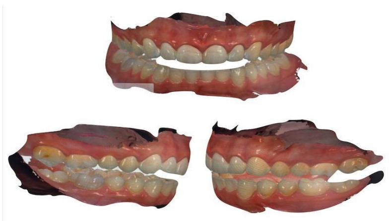
Figura 11 - Registro oclusal digital com JIG em posição no momento do escaneamento, determinando espessura do dispositivo interoclusal rígido.