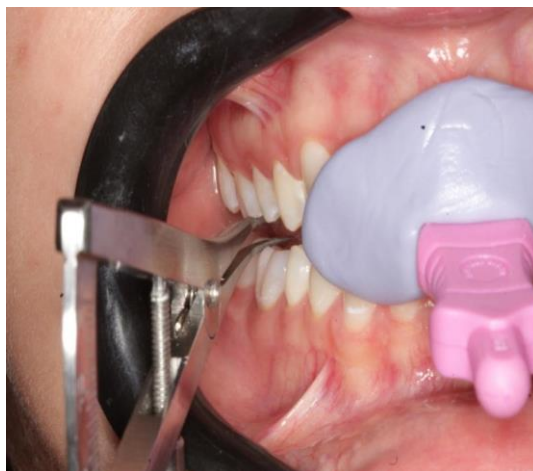
Figura 8 - Medição dos espaços Interoclusais com JIG em posição utilizando um Compasso Castroviejo (ICE, São Paulo, Brasil).