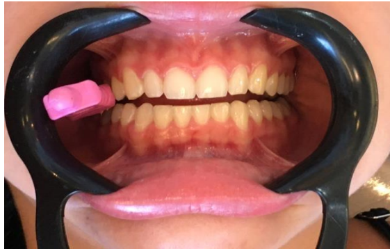
Figura 3 – Analise da distância oclusal com o dispositivo de registro na região posterior (2mm).