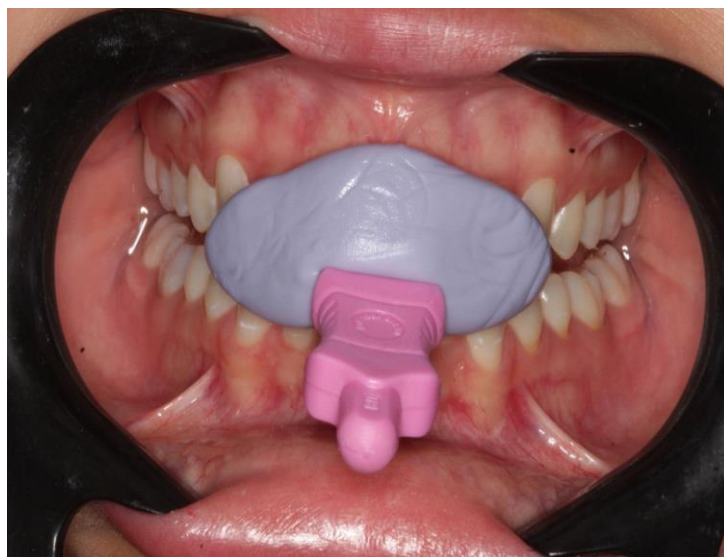
Figura 7 - Confeção do JIG com silicone de adição e a paleta de registro.