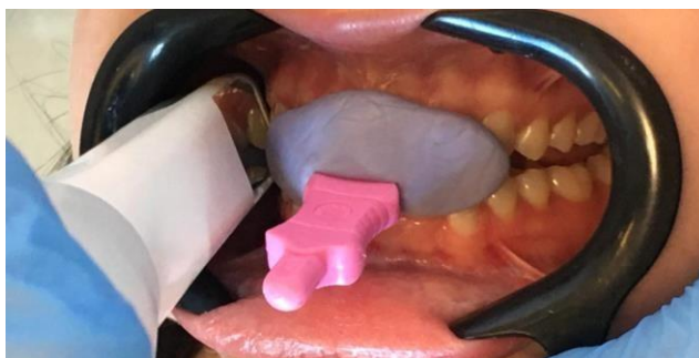
Figura 10 - Realização do escaneamento intraoral da relação maxilomandibular em desocclusão com o JIG.

Após a confecção do JIG foi feito o escaneamento da relação maxilo-mandibular em desocclusão para isso o JIG foi utilizado como artifício auxiliar, iniciando o escaneamento pela região posterior e em seguida em direção a anterior realizando movimento de zig e zag nas regiões superior e inferior. Após finalizar o escaneamento o arquivo foi enviado ao laboratório para a realização do desenho digital das dispositivo interoclusal rígida e confecção, impressão em 3d e suas finalizações.