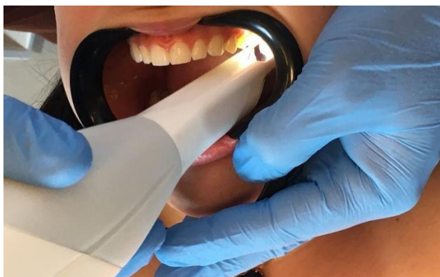
Figura 1 - Realização do escaneamento intraoral da arcada superior.

O escaneamento das arcadas foi realizado separadamente, iniciando nas faces ocluso-palatal/lingual, retornando o escaneamento pela face vestibular em ambos os arcos.