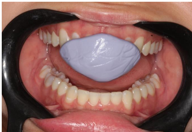
Figura 6 – Confeção do JIG com silicone de adição, posicionamento na região anterior da arcada superior.