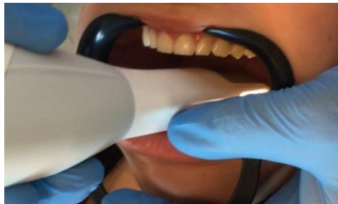
Figura 2 - Realização do escaneamento intraoral da arcada inferior.