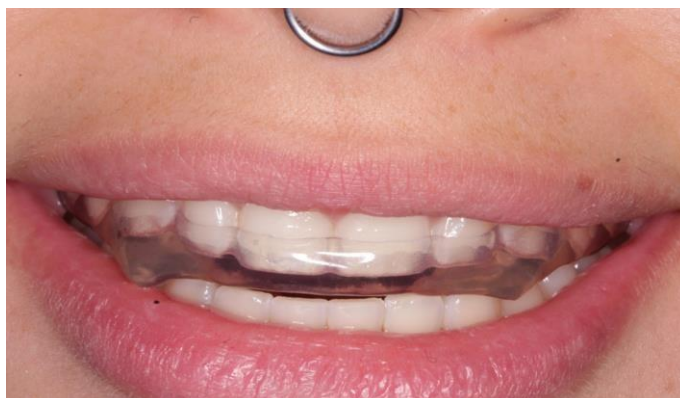
Figura 16 - Verifica o da adapta o do dispositivo interoclusal r gido na regi o anterior.