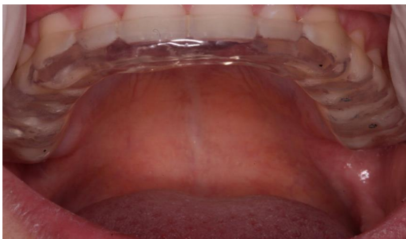
Figura 18 - Contatos prematuros encontrados.