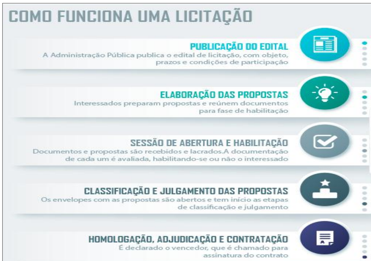
Figura 3 – Fases do certame licitatório

encadeamento de atos lógicos e cronologicamente ordenados em fases como, por exemplo: edital, recebimento das propostas, habilitação, classificação, homologação e adjudicação”, resumidas na figura a seguir: