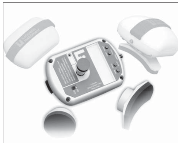
Figura 1 - Manual Muscle Test System

Realizados os procedimentos preliminares já descritos, passou-se a mensuração dos movimentos de extensão horizontal do ombro (EHO), abdução da articulação do ombro (AAO), flexão da coluna lombar (FCL), flexão do quadril (FQ) e abdução dos membros inferiores (AMI), através de um teste de esforço progressivo, onde cada