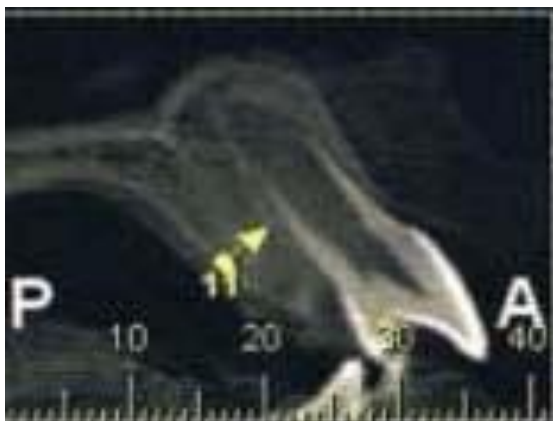
Figura 2: Corte sagital da maxila, confirmando o diagnóstico de cúspide em garra na unidade 11.