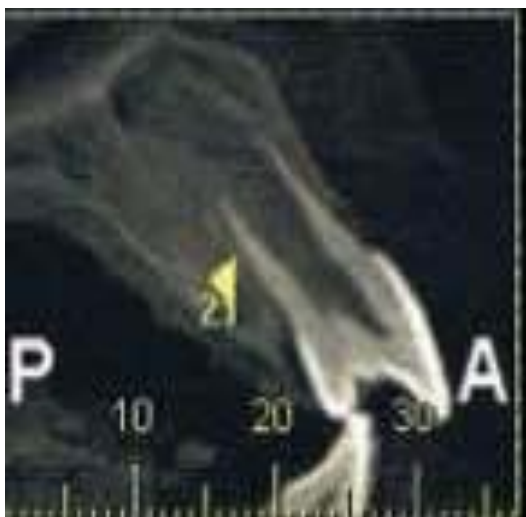
Figura 4: Corte sagital da maxila confirmando o diagnóstico de cúspide em garra na unidade 21.