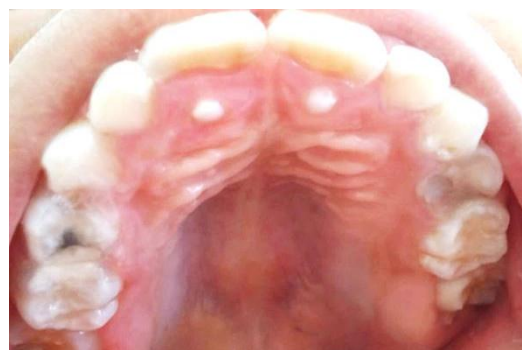
Figura 1: Exame intra-oral, evidenciando a presença de cúspides acessórias nas unidades 11 e 21 compatíveis com cúspide em garra.

As cúspides não se encontravam totalmente erupcionadas, o que justificou a sua preservação nas unidades dentárias acometidas, para, posteriormente, quando houver a erupção total das mesmas, avaliar a necessidade do desgaste das mesmas para se restabelecer a oclusão dentária do paciente.