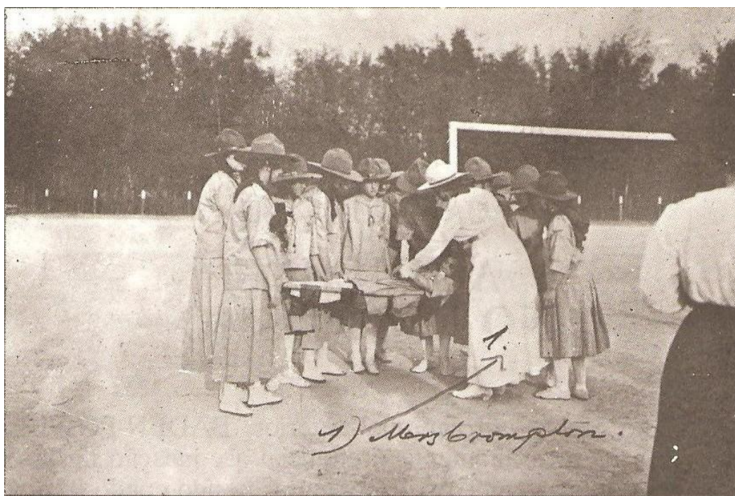
Figura 06: Foto de exercícios de Primeiros Socorros realizados no Parque Antártica.

Fonte: BLOWER, Almirante Bernard David. História do escotismo brasileiro: os primórdios do escotismo brasileiro (1910-1924). Rio de Janeiro: Centro Cultural do Movimento Escoteiro, 1994.