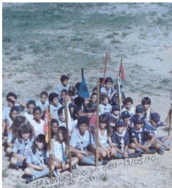
Figura 08: Foto de atividade do GEU no Parque da Cidade, em comemoração ao aniversário do grupo. Data: 13/05/1990

Desde a fundação do GEU, iniciou-se o estudo acerca do processo de coeducação em curso no escotismo brasileiro desde que as primeiras alcateias mistas experimentais começaram a funcionar em 1978. Sendo oficializada a coeducação de escoteiras, guias e lobinha, respectivamente, em 1980, 1981 e 1982.