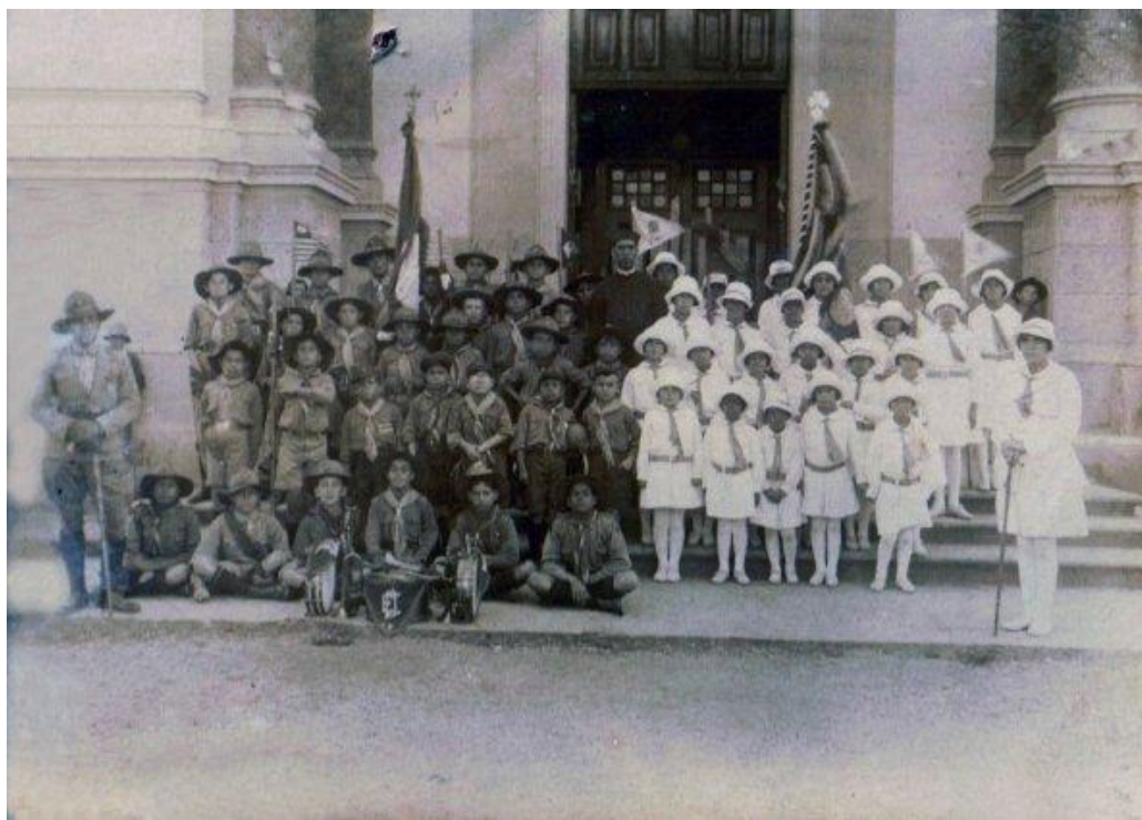
Figura 01: Foto de escoteiros do 1º Grupo Escoteiro São Paulo (esquerda) e um grupo de Bandeirantes (direita) Data: Primeira metade do século XX.