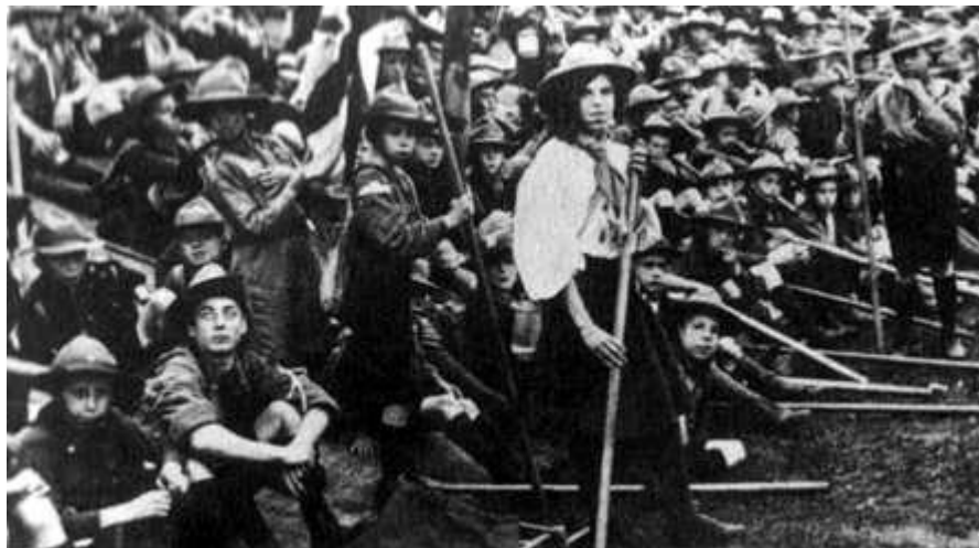
Figura 02: Foto do Raly Escoteiro, Palácio de Cristal, Londres – Uma menina uniformizada com trajes escoteiros.

“O Escotismo é um movimento, não uma organização” (BADEN-POWELL, 2009), e enquanto movimento poderia ser modificado, recomposto com o tempo, com as experiências e com as mudanças. A circunstância que levou B.-P. a criar o movimento bandeirante foi a presença de mulheres entre escoteiros.